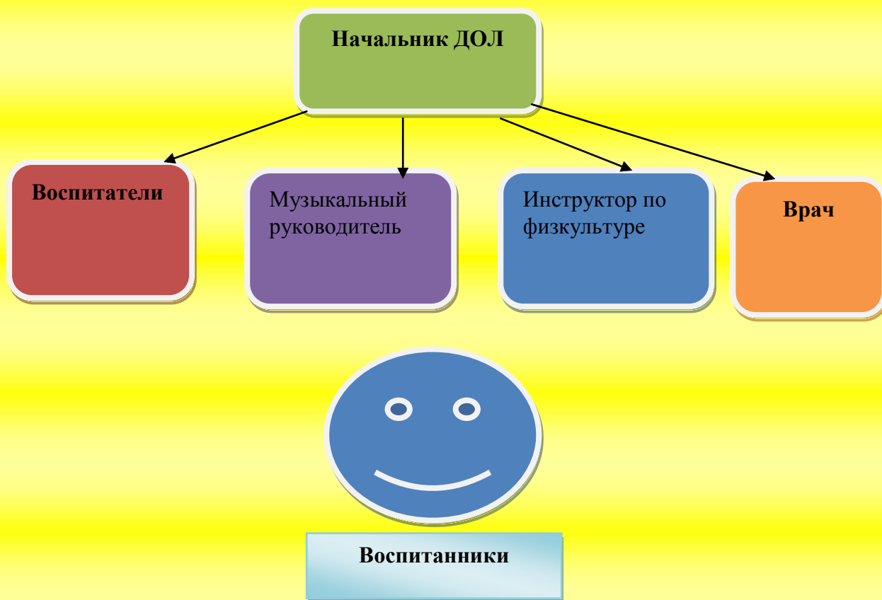
Схема управления программой